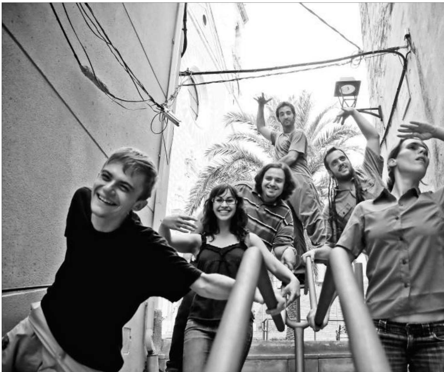
► Lecirke, una de las bandas tarraconenses más prometedoras.